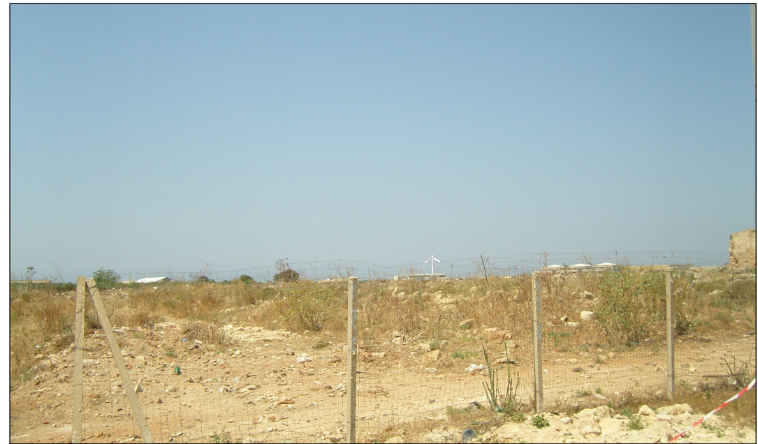
Cono di visibilità n° 3