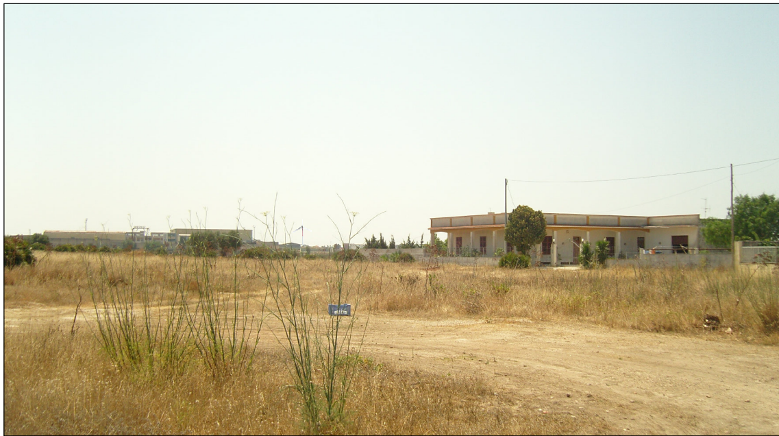
Cono di visibilità n° 4