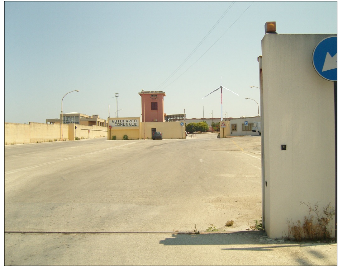
Cono di visibilità n° 1