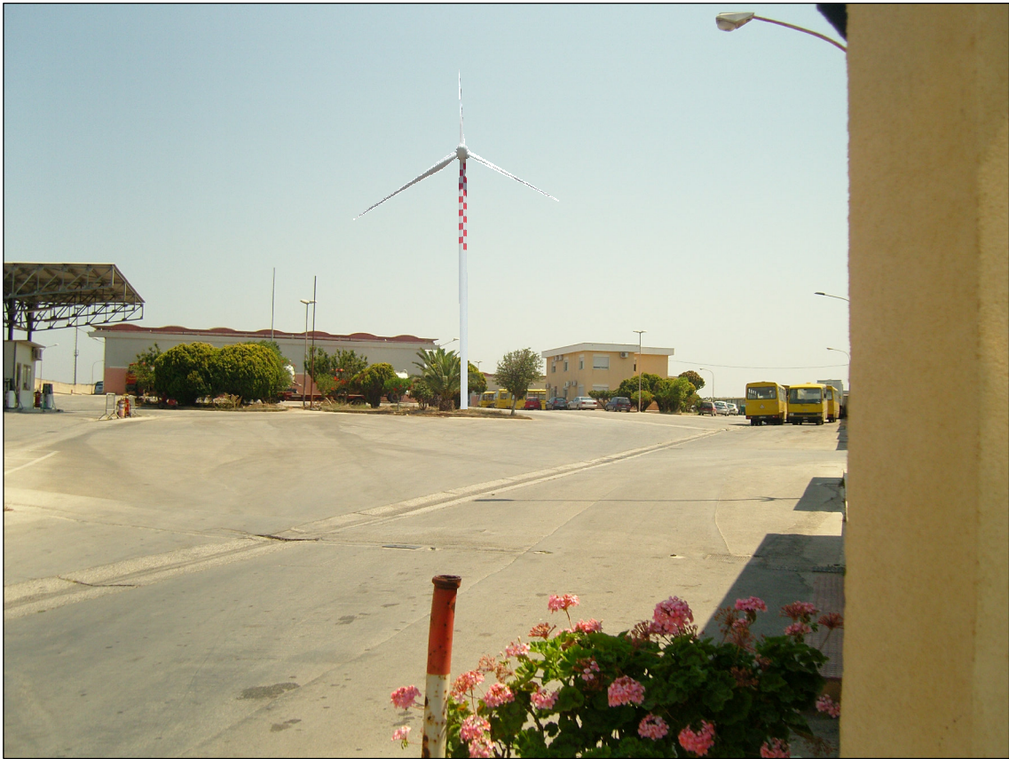
Cono di visibilità n° 2